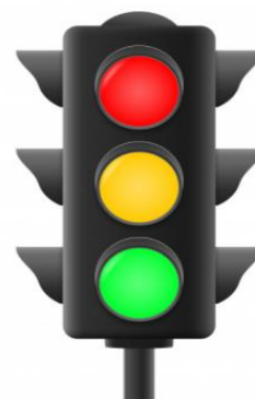
PRIMEIRO DISPOSITIVO SURTIDO NA INGLATERRA